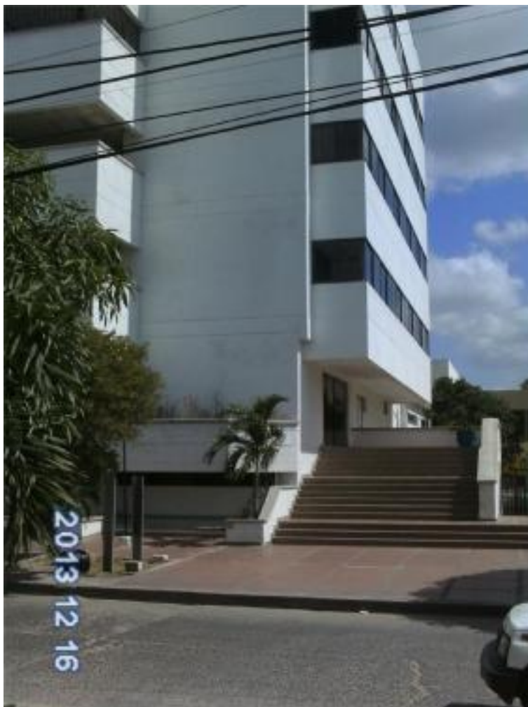
NUEVA SEDE LA DE DEFENSORIA DEL PUEBLO REGIONAL GUAJIRA