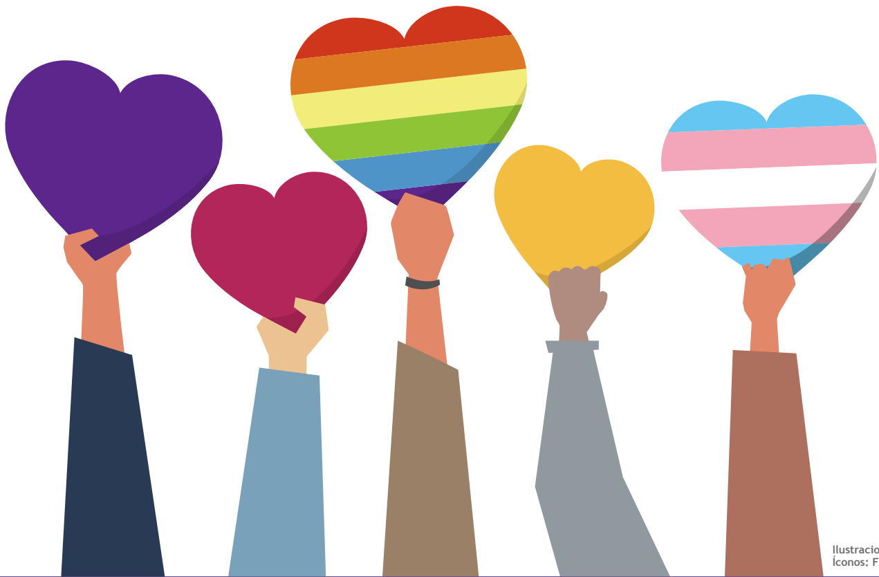
Ilustraciones: Freepik Íconos: Flaticon

se ven sometidas a actos de vulneración de sus cuerpos y al miedo a permanecer en la calle por los acosos sexuales de transeúntes.