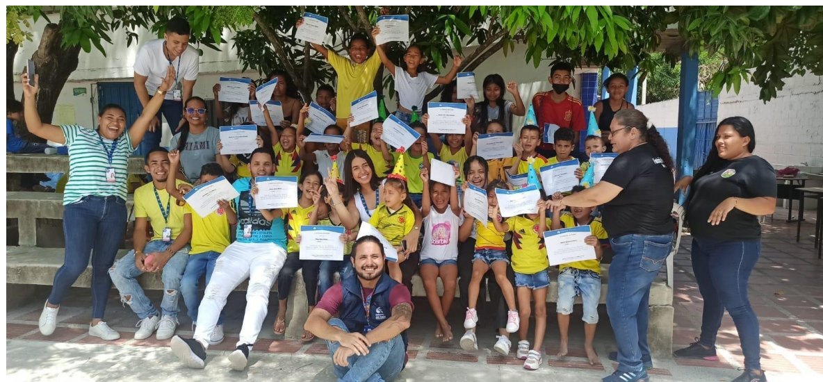
Proceso de fortalecimiento y formación en Derechos a NNA migrantes en Soledad.