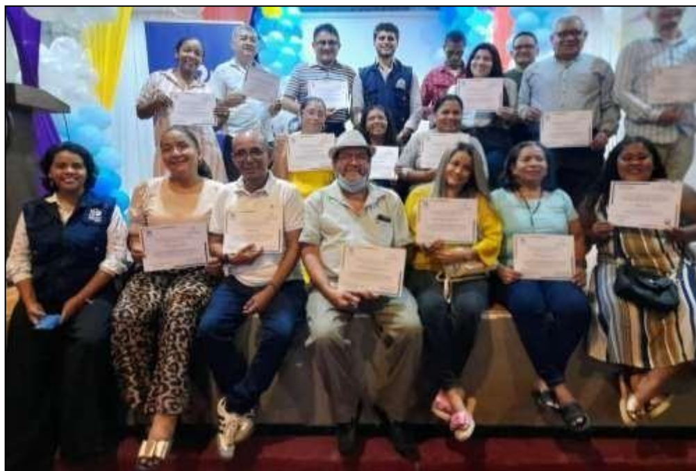
Registro fotográfico: 2. Certificación del diplomado sobre el acuerdo de paz en el municipio de Puerto Colombia