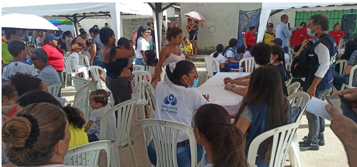
Jornada de atención a población víctima y migrante en Soledad, barrio Nueva Esperanza.