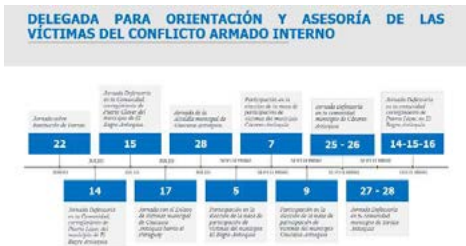
Cronograma de Actividades realizadas Línea de tiempo