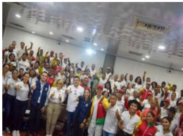
Capacitación a funcionarios del IDER en el marco de la NO VIOLENCIA en ámbitos deportivos.