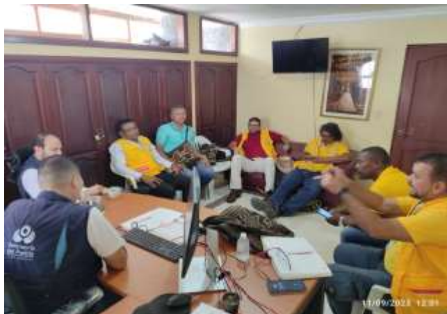
Espacios de dialogo en el marco del des escalamiento de conflictos sociales.