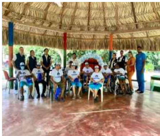
Jornada de promoción y divulgación de derechos a la salud.

Periodo a reportar: 01 de enero a 31 de diciembre de 2023