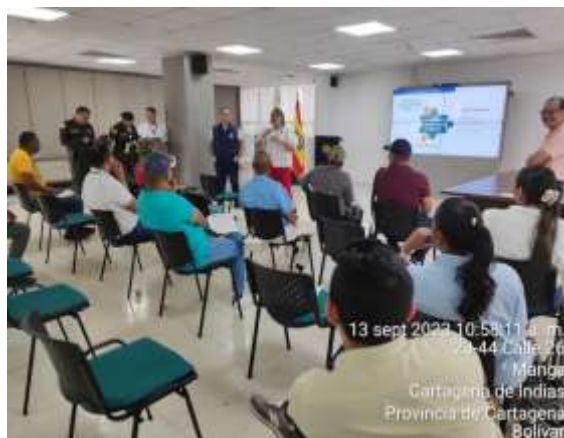
Reunión de protección de líderes amenazados.