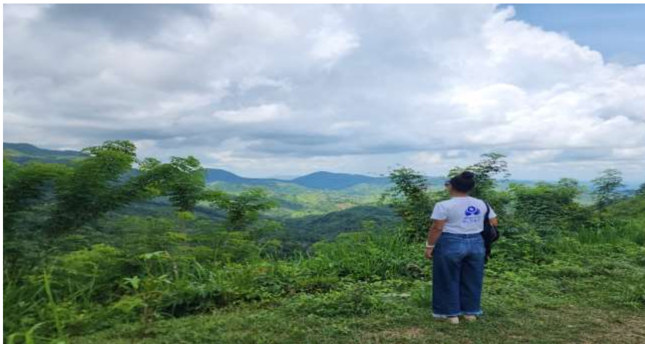
Visita a la subregión de Montes de María - Marzo del 2023.

Periodo a reportar: 01 de enero a 31 de diciembre de 2023