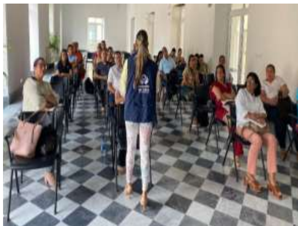
Capacitación a funcionarios del sector salud en IVE.

Periodo a reportar: 01 de enero a 31 de diciembre de 2023