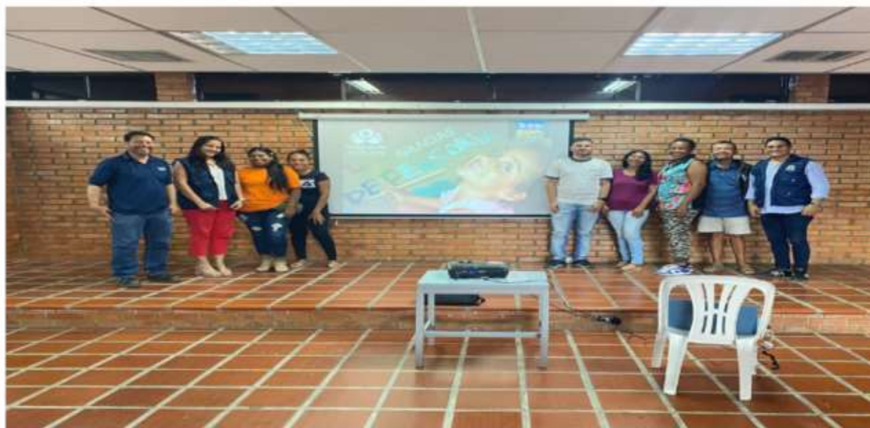
Realización de cursos pedagógicos.

Periodo a reportar: 01 de enero a 31 de diciembre de 2023