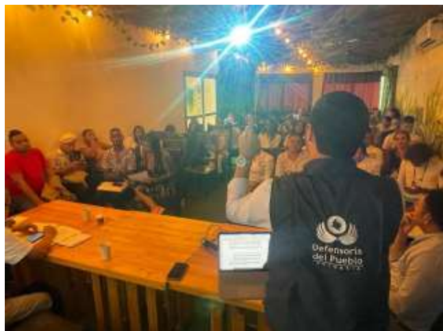
Mesa de dialogo territorial con líderes LGBTQ+ de Montes De María.