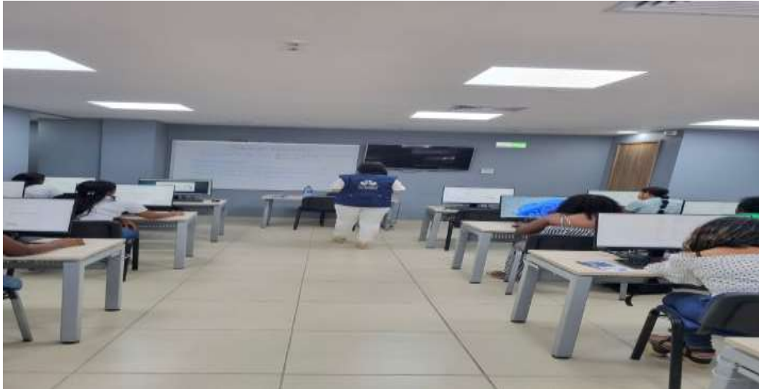
Capacitación a mujeres del proyecto Argos.