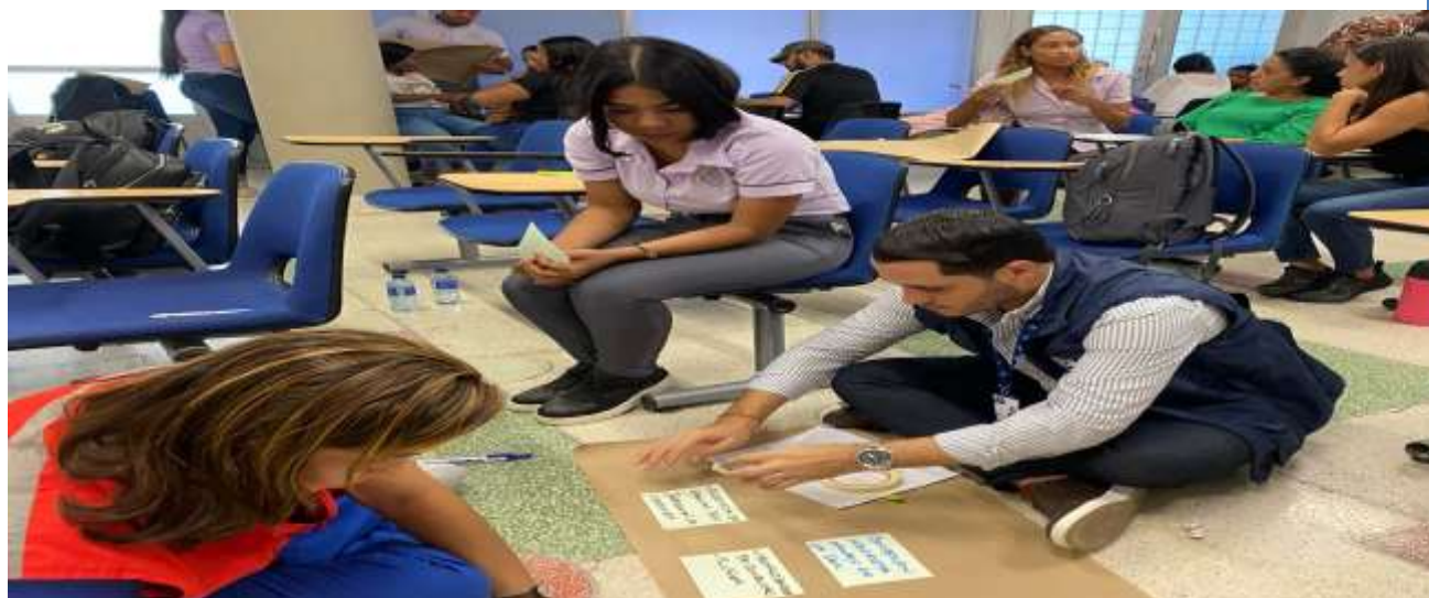
Mesa de trabajo interinstitucional para el fortalecimiento de la VBG.

Periodo a reportar: 01 de enero a 31 de diciembre de 2023