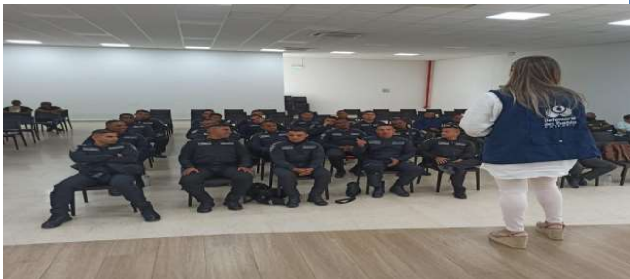
Promoción y divulgación de derechos y rutas de atención a la unidad de mantenimiento y orden de la Policía Nacional.