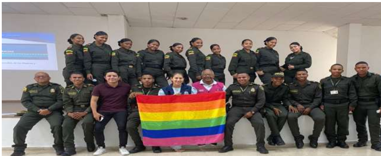
Taller de sensibilización a la Policía Metropolitana de Cartagena en conmemoración al orgullo Gay.

Periodo a reportar: 01 de enero a 31 de diciembre de 2023