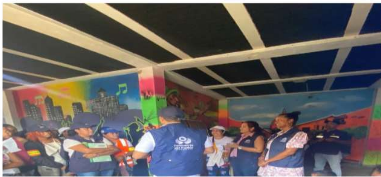
Promoción y Divulgación en el municipio de Bayunca realizado el 7 de junio de 2023.