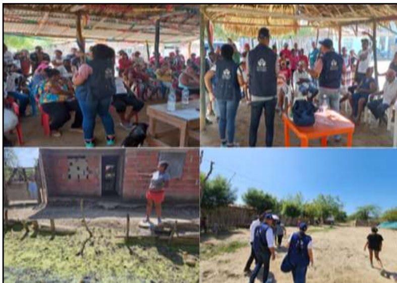
Jornada descentralizada en las comunidades de Barranca Vieja y Barranca Nueva del municipio de Calamar, 25 a 27 de enero de 2023.

Periodo a reportar: 01 de enero a 31 de diciembre de 2023