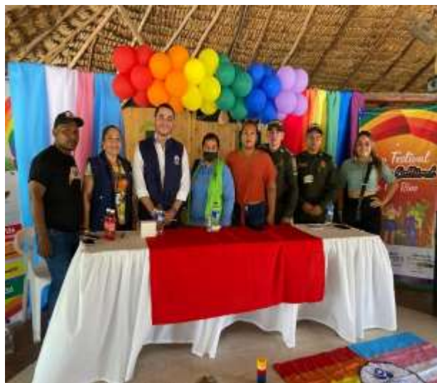
Conmemoración orgullo LGBTQ+.