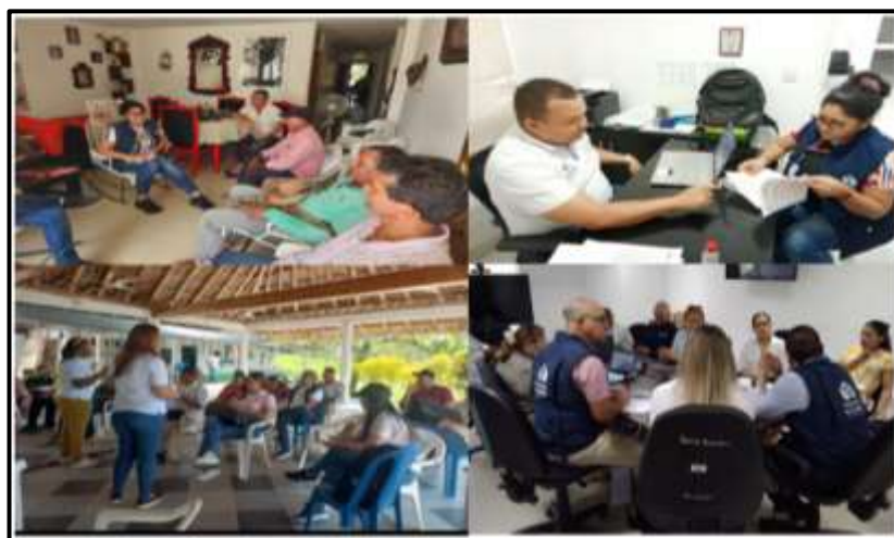
Seguimiento a los procesos de retorno y reubicación de la población en situación de desplazamiento forzado en Bolívar, año 2023.