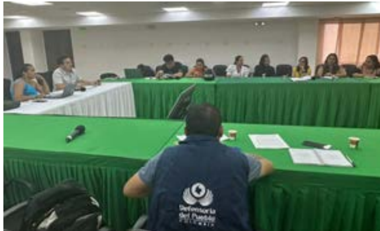
Acompañamiento Mesa Técnica de Promoción y Articulación de Trabajo de Obras y Actividades con Contenido Reparador y Restaurador - TOAR - en el Departamento del Huila.