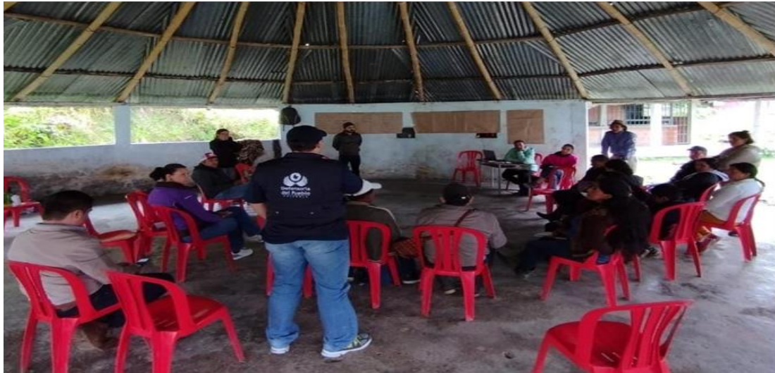
Prevención en el territorio Sur