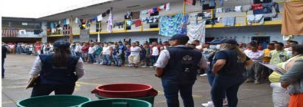
Centro Transitorio de Pitalito