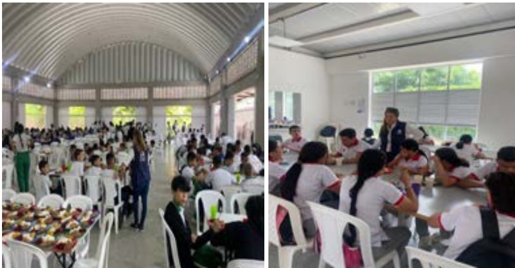
Visitas a diferentes Instituciones Educativas, de Neiva, Garzón y Hobo del Departamento del Huila