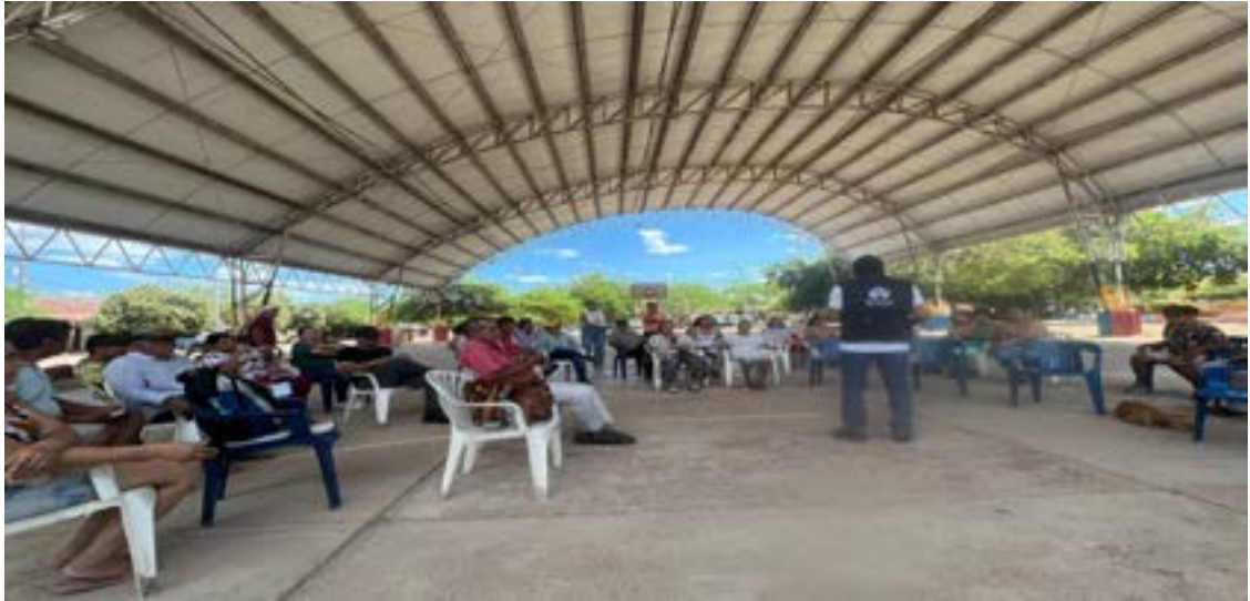
Jornadas de capacitación SIVJNR para la paz y la Reconciliación municipio de Villa Vieja

Periodo a reportar: 01 de enero a 31 de diciembre de 2023