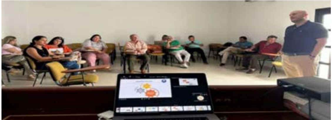
Barras Académicas Dirigida A Defensores Públicos

Periodo a reportar: 01 de enero a 31 de diciembre de 2023