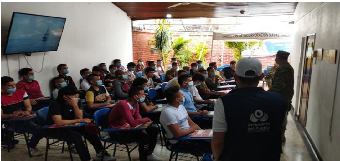
Acompañamiento como ente ministerio público, garante en proceso de incorporación jóvenes, servicio militar primer contingente año 2023, fuerza Naval