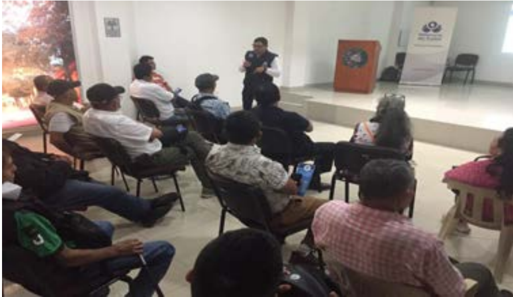
Capacitación a líderes comunales del municipio de Garzón Huila.