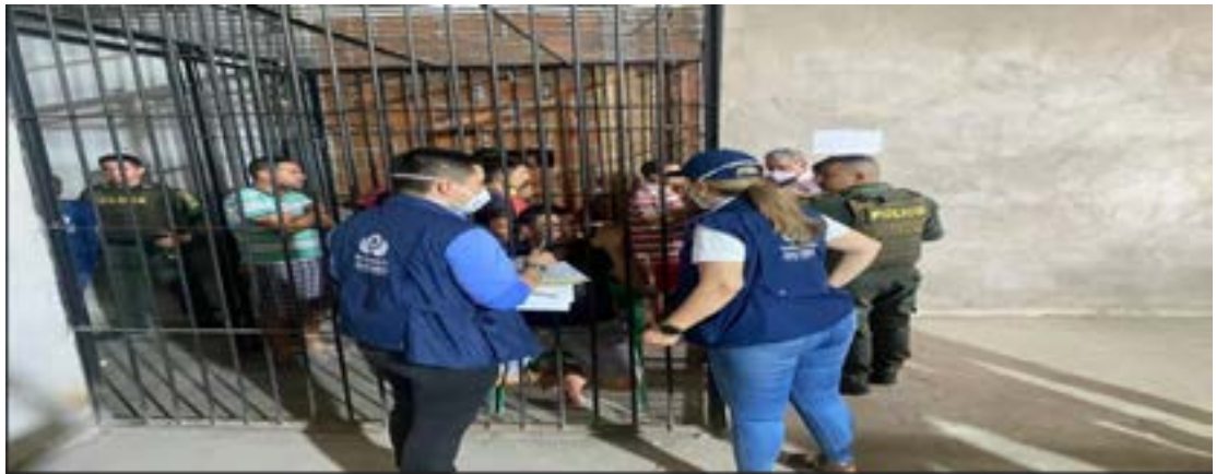
Visita Centro Transitorio Bodegas de Alpina