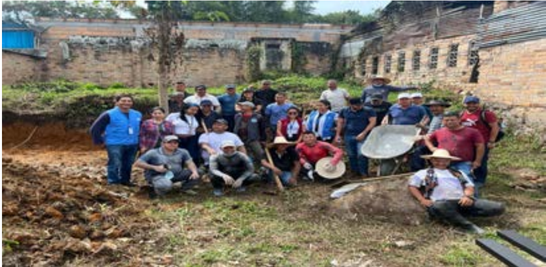
Adecuación Biblioteca comunitaria San Adolfo - Acevedo articulación institucional ARN - JEP- Defensoría del Pueblo - Misión de Observación

Periodo a reportar: 01 de enero a 31 de diciembre de 2023