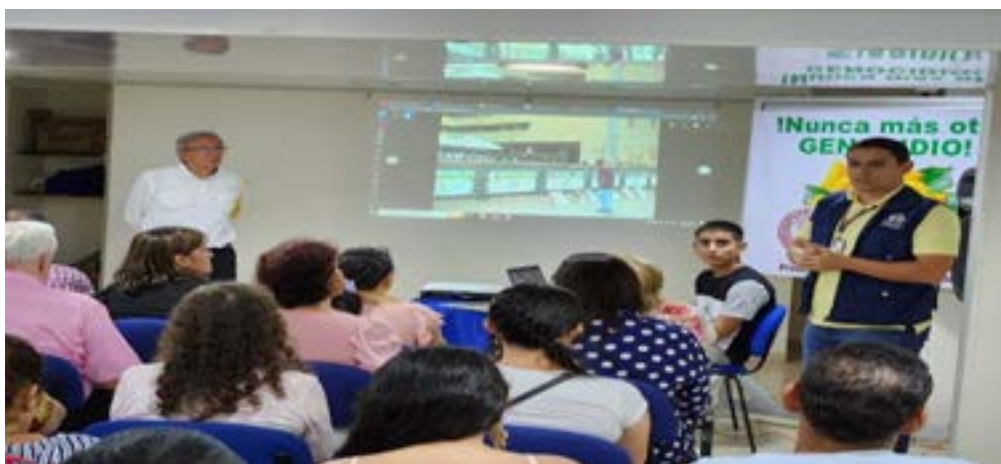
Divulgación con Organizaciones De Víctimas de Estado Sobrevivientes UP