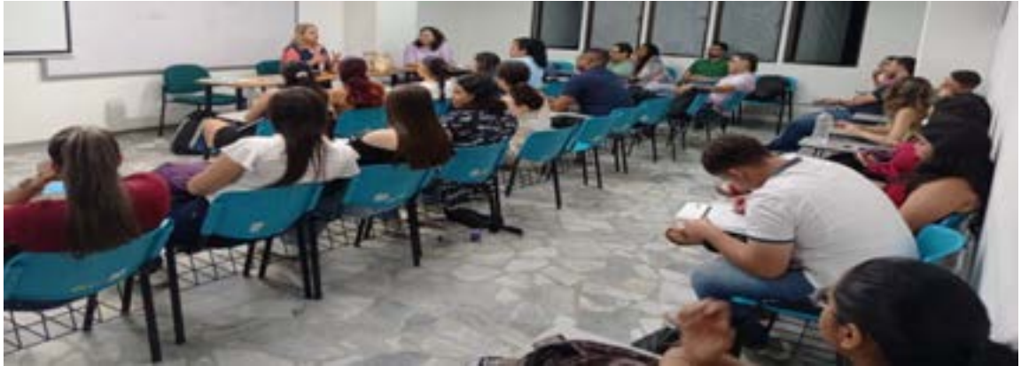
Jornadas de divulgación de derechos y oferta institucional estudiantes Universidad Cooperativa

Periodo a reportar: 01 de enero a 31 de diciembre de 2023