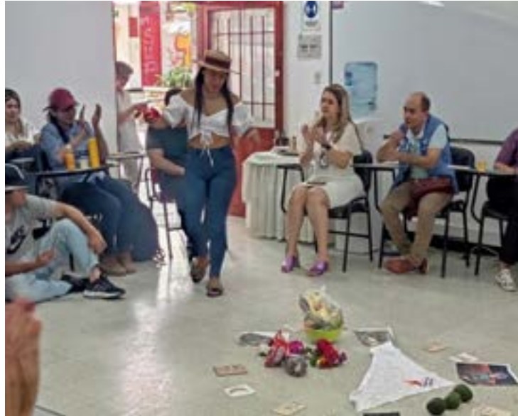
Conmemoración Día internacional de los DDHH 2023