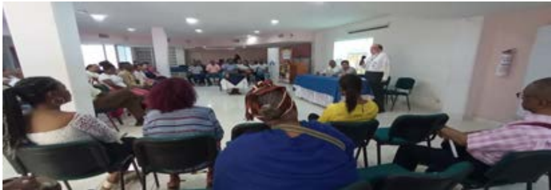
Formación Y Divulgación Con Comunidades Afrodescendientes Del Huila