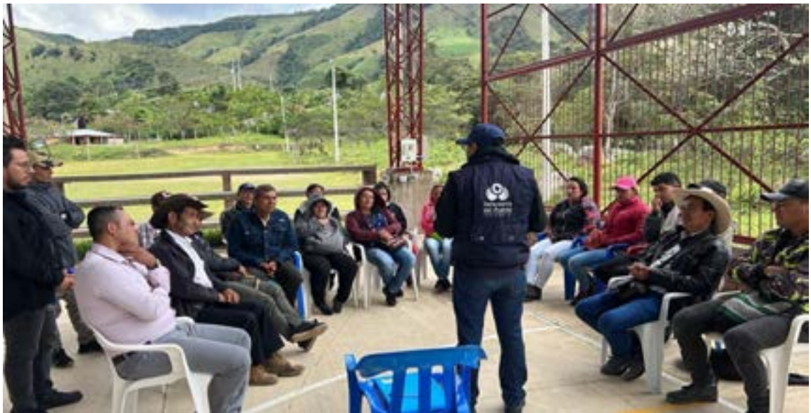
Municipio de Colombia - Zona Rural Potrero Grande formación en SIVJNRN en articulación con el DAP JEP Nación territorio y la personería de Colombia