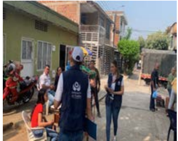
Defensoría en tu comunidad barrio las Granjas Neiva