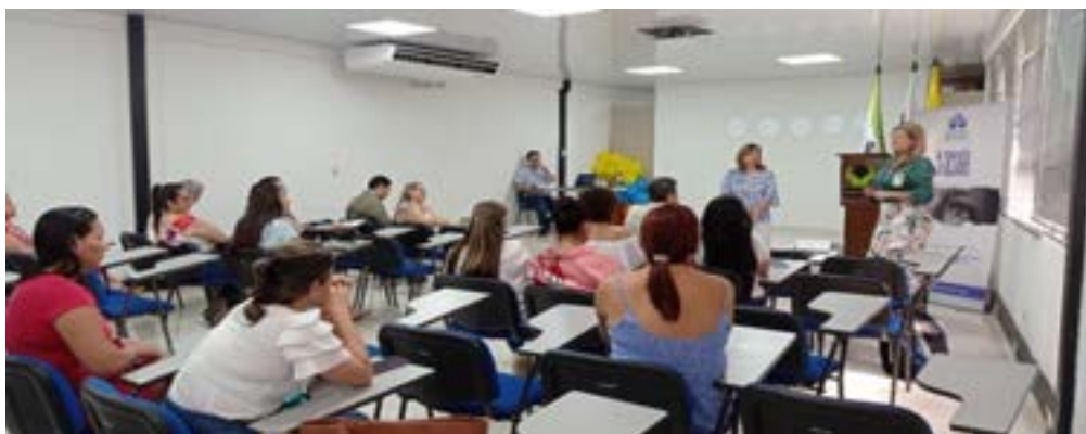
Trabajo Articulado de Formación Para NNA con el ICBF