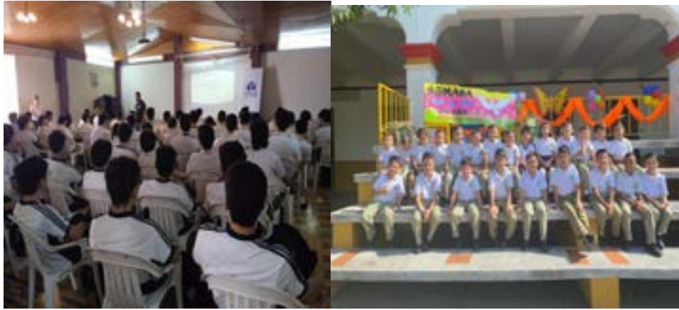
Capacitación población estudiantil Colegio Salesiano en el marco de la Semana por la paz.