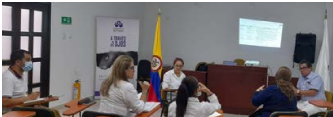
Acompañamiento de las personas afectadas por la licencia ambiental con Resolución 899 de 2009 en el seguimiento de DESC