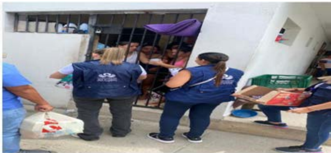
Visita Centro Transitorio de Mujeres - Caguán