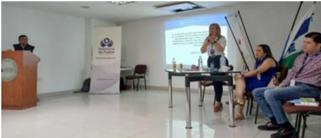
Actividades de formación en participación, control social y veedurías ciudadanas frente al derecho a la participación a líderes comunales y presidentes de JAC de zona urbana y rural