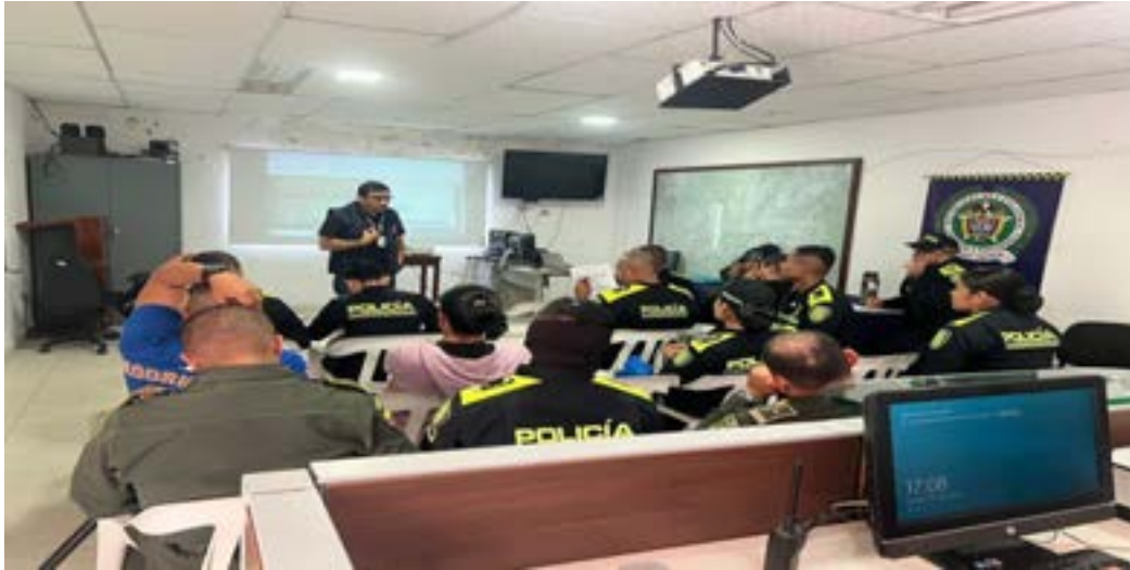
Capacitación servidores públicos integrantes Policía Nacional zonas Centro y sur

Periodo a reportar: 01 de enero a 31 de diciembre de 2023