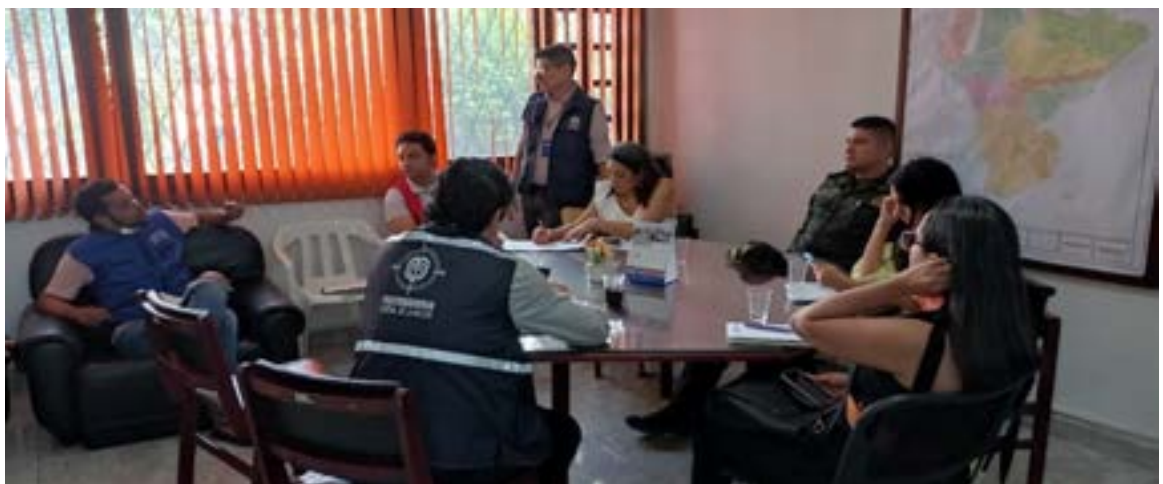
Regional Huila en la Octava mesa pública penitenciaria como un escenario de articulación interinstitucional para la búsqueda de soluciones a las problemáticas presentadas en los Centros de Detención Transitorios CDT y Centro Penitenciario de Neiva.