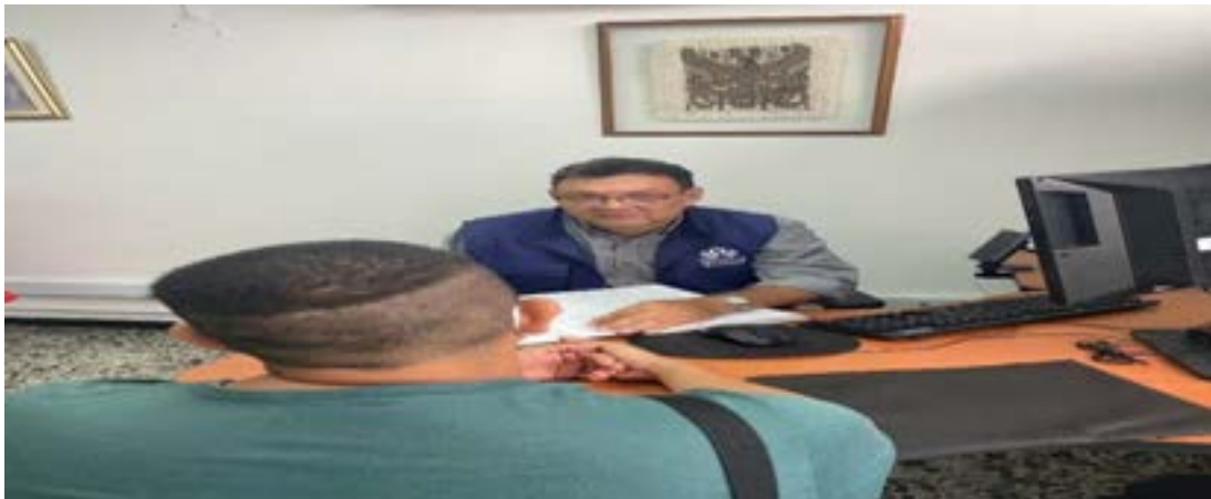
Entrevistas Grupo de Investigación Para La Defensa