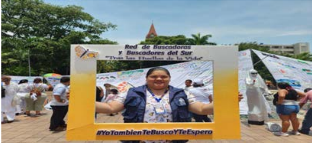
Encuentro Departamental “Yo También Te busco y Te espero”, organizado por la red de buscadoras y buscadores del sur.

Periodo a reportar: 01 de enero a 31 de diciembre de 2023