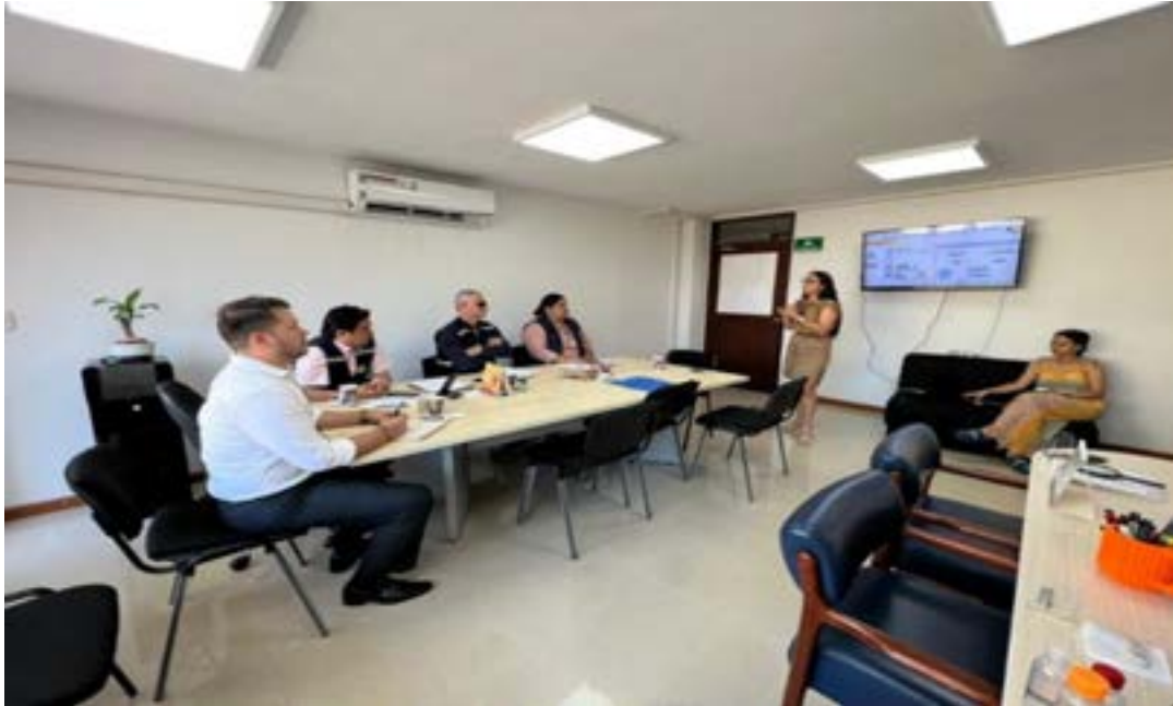
Tercera sesión de la Comisión Regional del Ministerio Público para la Justicia Transicional del Huila. Agosto 18 de 2023.