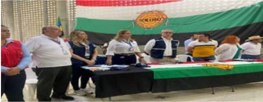
Regional Huila en la Mesa de concertación del Consejo Regional indígena del Huila - CRIHU-.