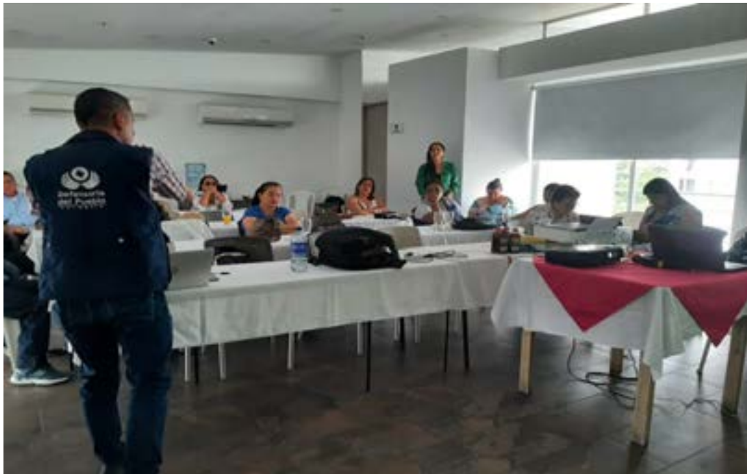
Plenario de la Mesa de Participación Efectiva de Víctimas del Huila. Diciembre 26 de 2023.