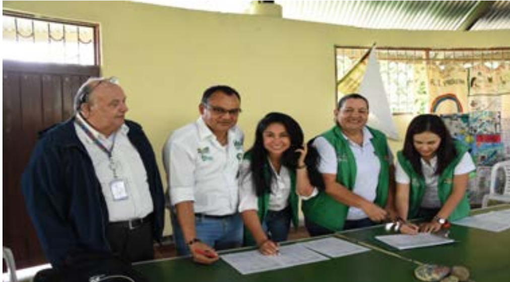
Acompañamiento a comunidades indígenas Pueblos Dujos Tamas y Páez del Caguán.