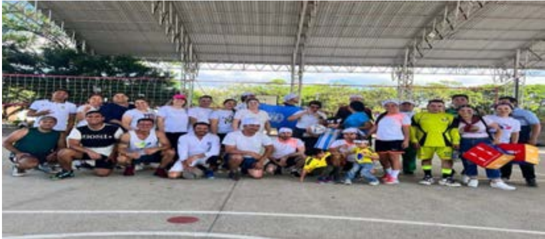
Juntanza en familia por la paz - Semana por la paz Neiva Parque Metropolitano