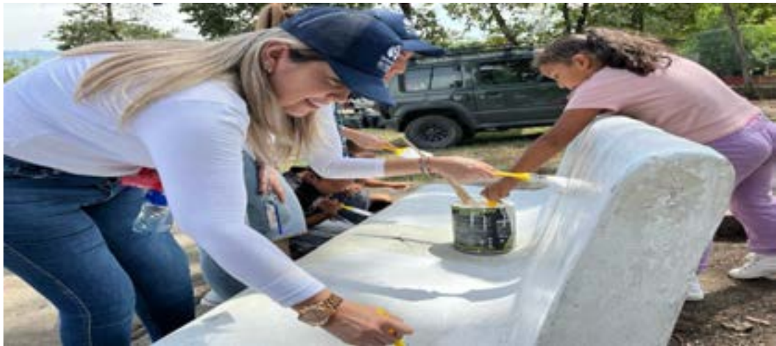
Semana por la paz municipio de Algeciras comunidad y personas en proceso de Reincorporación