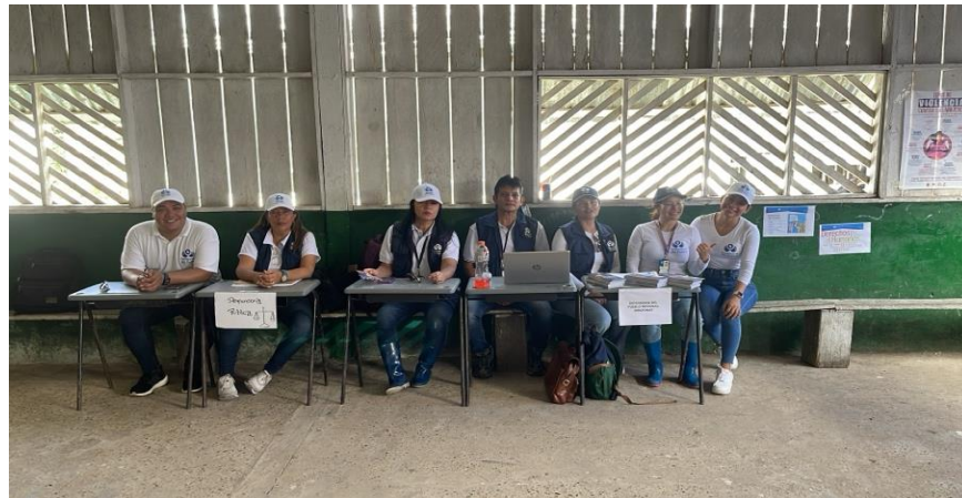
Defensoría Publica en Jornada de Atención Comunidad Nazareth

Periodo a reportar: 01 de enero a 31 de diciembre de 2024