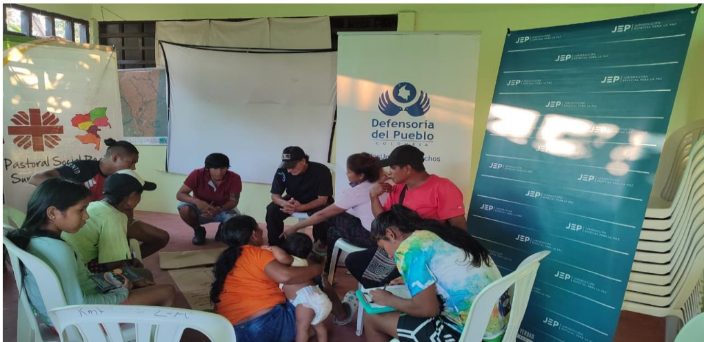
Talleres En Justicia Propia y Justicia Restaurativa