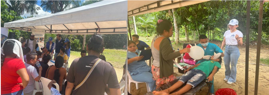
Jornada Barrio Manguaré, 17 de abril de 2024

Periodo a reportar: 01 de enero a 31 de diciembre de 2024