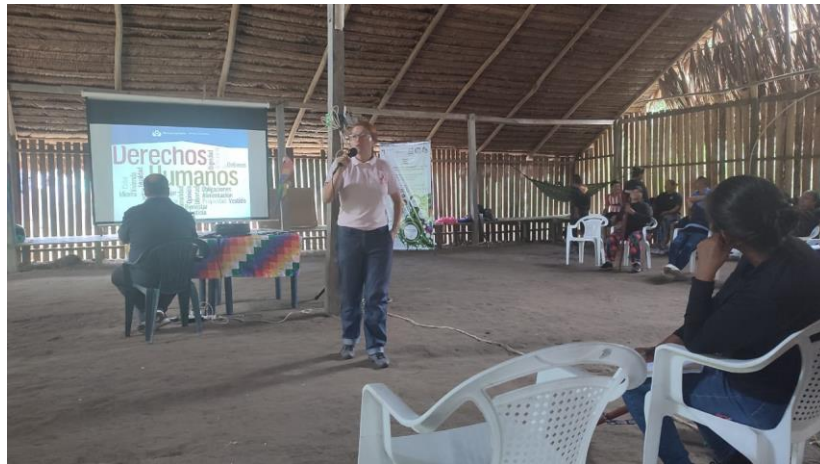
Socialización Quehacer Defensorial-Maloka Yoi

Periodo a reportar: 01 de enero a 31 de diciembre de 2024