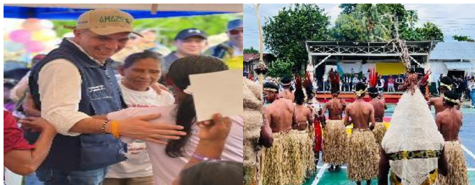
Jornada Nazareth, 16 de abril de 2024