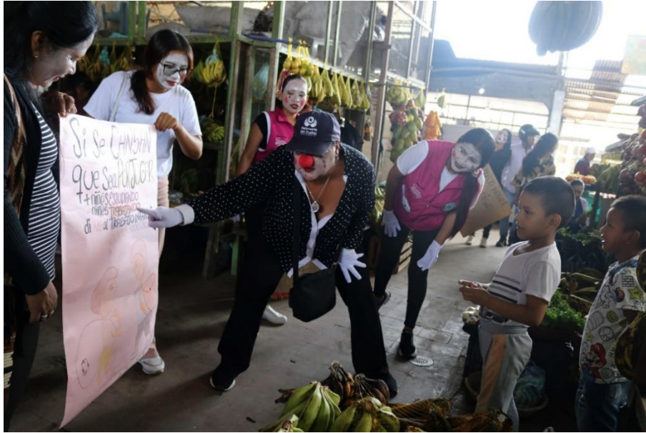
Conmemoración Trata de Personas

Periodo a reportar: 01 de enero a 31 de diciembre de 2024