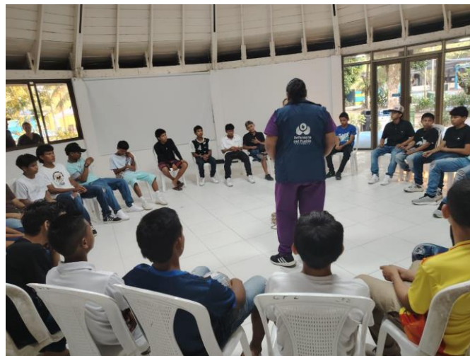
Círculos de la Palabra con Adolescentes