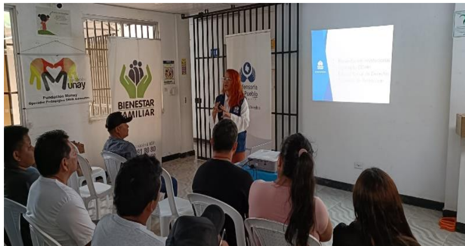
Capacitaciones en Derechos Humanos a Servidores Públicos