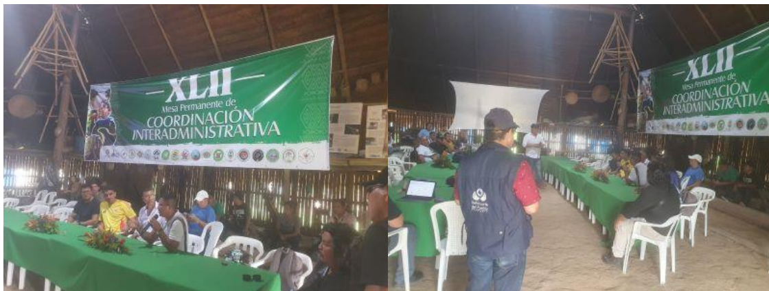
Mesa Permanente De Coordinación Interadministrativa