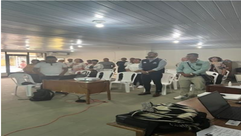
Sesión Mesa Departamental Efectivo de Víctimas Amazonas

Periodo a reportar: 01 de enero a 31 de diciembre de 2024