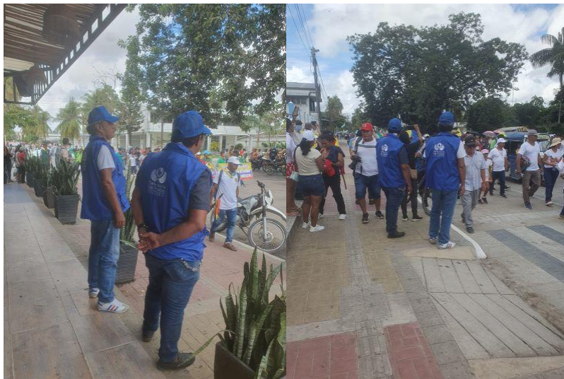
Acompañamiento seguimiento a la Marcha 1 de Mayo de 2024

Periodo a reportar: 01 de enero a 31 de diciembre de 2024