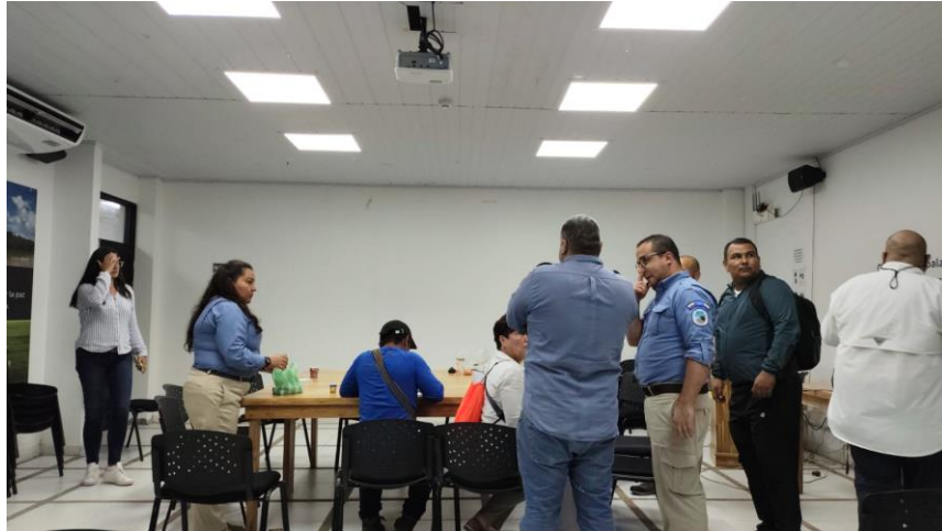
Reunión PANI-AICMA, con participación de PNN y Defensoría del Pueblo

Periodo a reportar: 01 de enero a 31 de diciembre de 2024