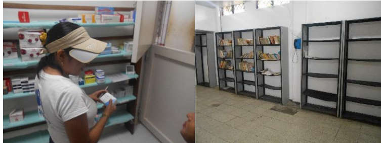
Política Criminal y Penitenciaria EPMSC Leticia

Periodo a reportar: 01 de enero a 31 de diciembre de 2024