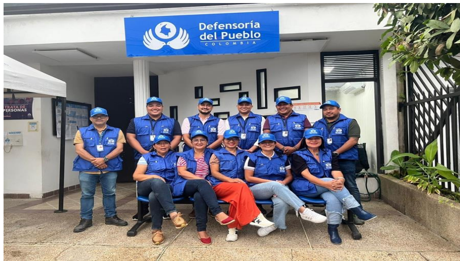
Equipo de Defensores Públicos Regional Amazonas