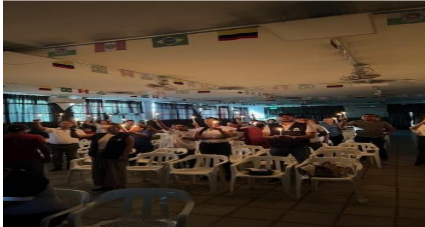
Día nacional de Memoria y Solidaridad con las Víctimas, acto simbólico el 09/04/2023

Periodo a reportar: 01 de enero a 31 de diciembre de 2024