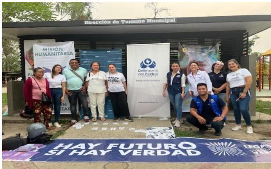
Conmemoración día internacional de las víctimas de desaparición forzada 30 de agosto de 2024.