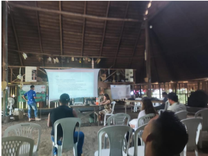
Reunión de seguimiento en el marco de la MPCl de abril de 2024

Periodo a reportar: 01 de enero a 31 de diciembre de 2024