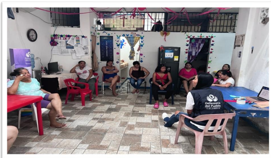
Taller de orientación Ley de utilidad Pública con Mujeres PPL - Centro Penitenciario de Leticia