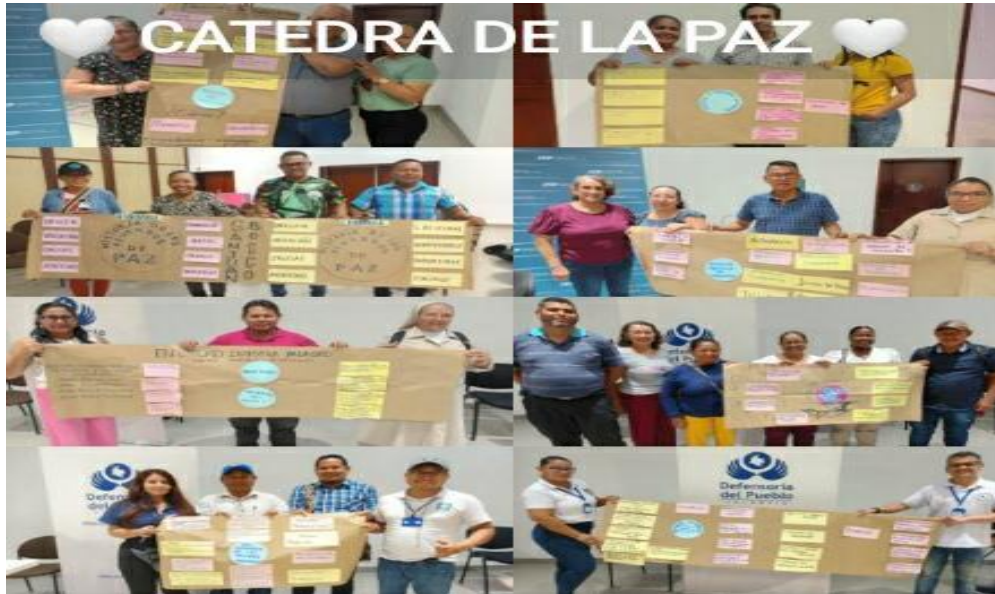
Talleres Docentes Fortalecimiento Catedra para la Paz

Periodo a reportar: 01 de enero a 31 de diciembre de 2024