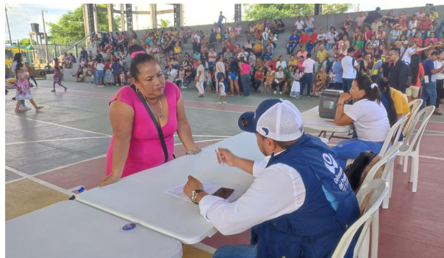
Defensoría Publica en Jornada de Atención Comunidad