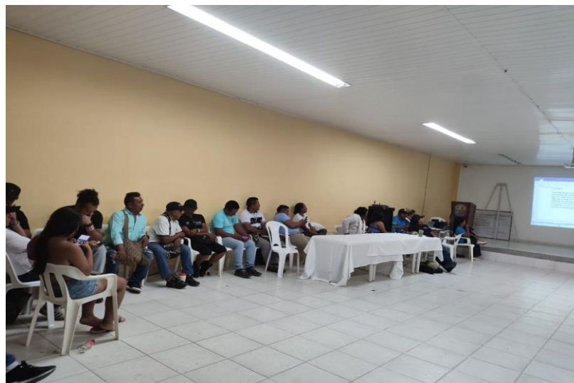
Reunión Comité Local de Prevención de los PIA