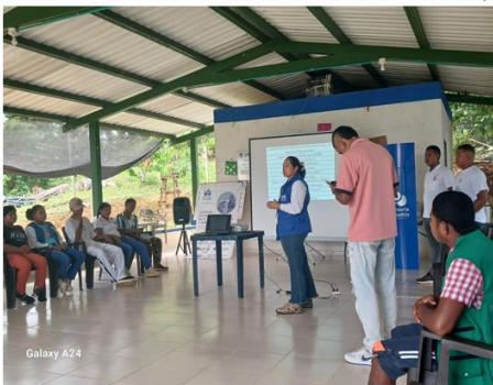
Vereda Las Negritas. Abril a junio 2024