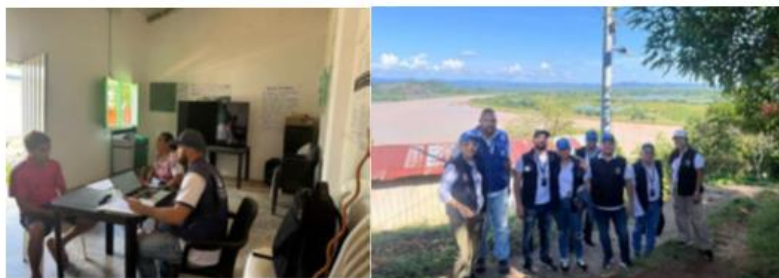
Corregimiento Colorado, Municipio de Nechi-Antioquia 24 y 25 de Julio de 2024