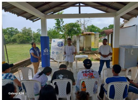
Vereda La Capilla-Abril a junio 2024.