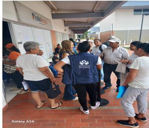
Servicio Farmacéutico Todo Drogas. 8 de abril de 2024 Caucasia-Antioquia

Evidencia. Acompañamiento al llamado de la comunidad por la atención