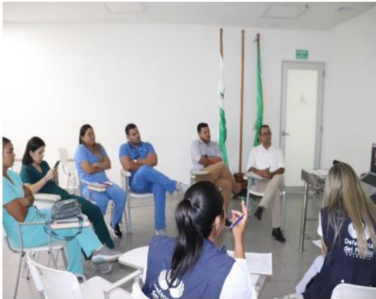
ESE Hospital Cesar Uribe Piedrahita Caucasia-Antioquia. 25 de julio de 2024

Evidencia. Acompañamiento al llamado de la comunidad por la atención