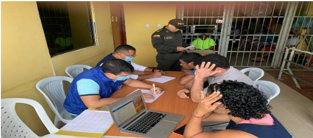
Atención Privados de la Libertad (PPL).