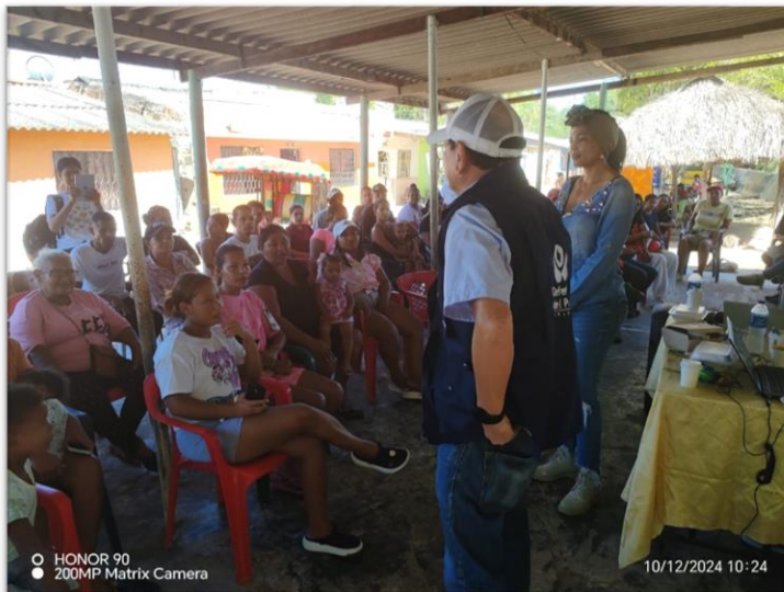
Consulta Previa en Maria La Baja, Corregimiento el Nispero.