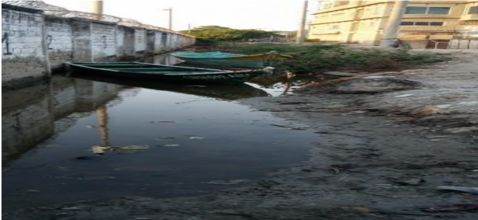
Situación actual del sector - barrio San Isidro.

Periodo a reportar: 01 de enero a 31 de diciembre de 2024