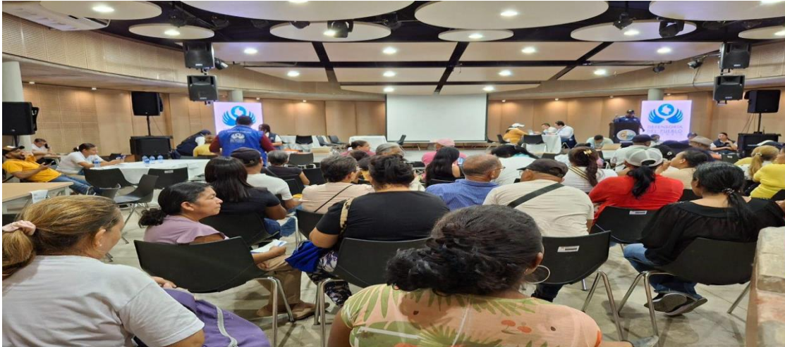
Jornada Descentralizada en el Carmen de Bolívar.

Periodo a reportar: 01 de enero a 31 de diciembre de 2024