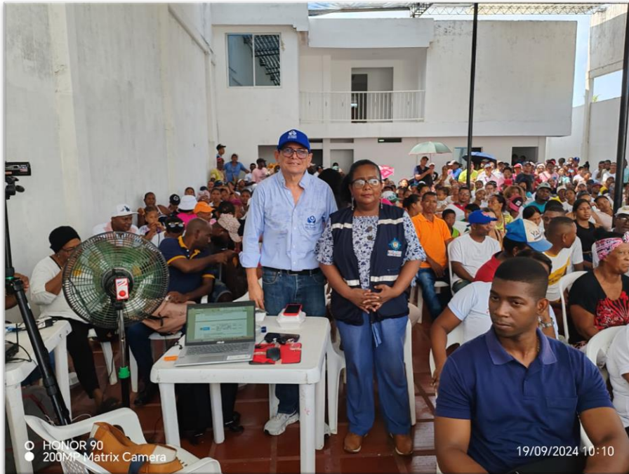
Consulta previa en Pasacaballos, Distrito de Cartagena.

Periodo a reportar: 01 de enero a 31 de diciembre de 2024