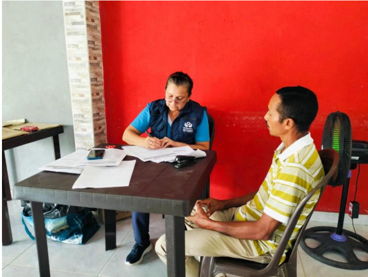
Jornada toma de declaraciones población subregión Montes de María.

Periodo a reportar: 01 de enero a 31 de diciembre de 2024