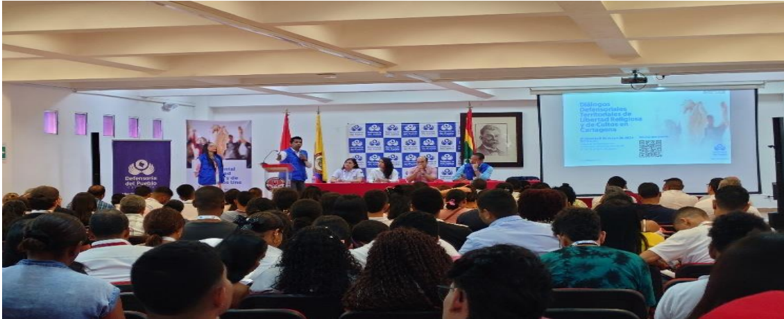
Diálogo regional de Libertad de Culto.

Periodo a reportar: 01 de enero a 31 de diciembre de 2024