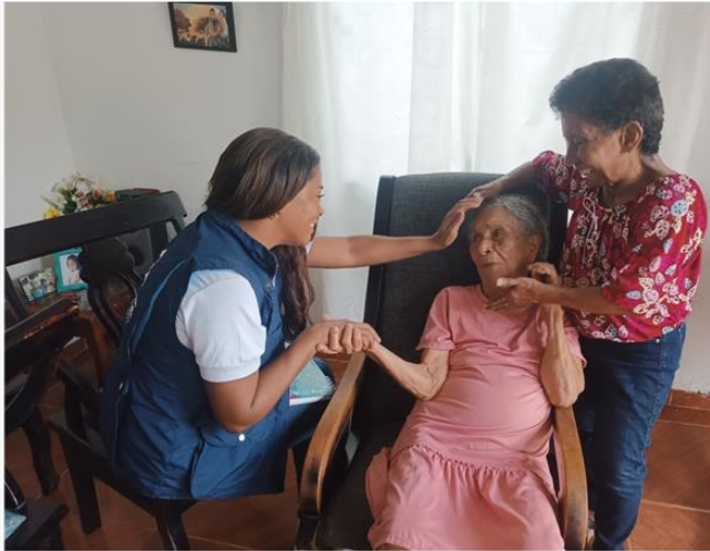
Valoración de Apoyo dirigida a persona con condición de discapacidad. Marzo 2024.

Periodo a reportar: 01 de enero a 31 de diciembre de 2024