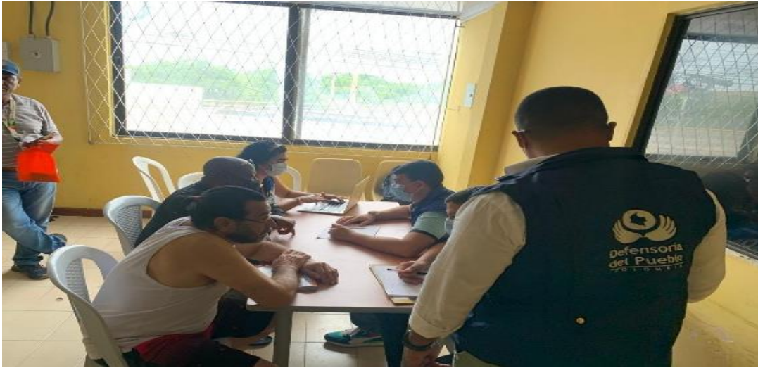
Atención Privados de la Libertad (PPL).

Periodo a reportar: 01 de enero a 31 de diciembre de 2024