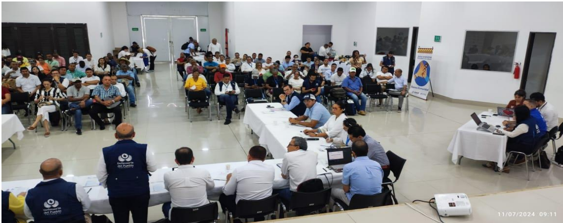
Diálogo regional de Servicios Públicos.