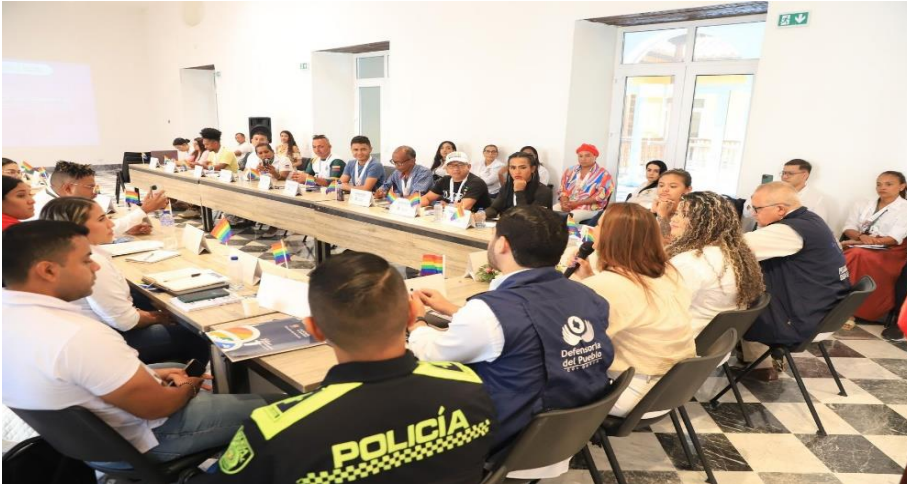
Mesa Técnica Departamental Frente a la Política Publica de Diversidad Sexual y Género.

Periodo a reportar: 01 de enero a 31 de diciembre de 2024