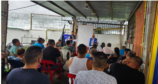
Ilustración 1. capacitación DDHH a PPL

Periodo a reportar: 01 de enero a 31 de diciembre de 2024