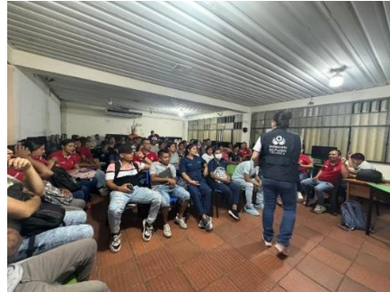
Ilustración 2. capacitación Institución Educativa