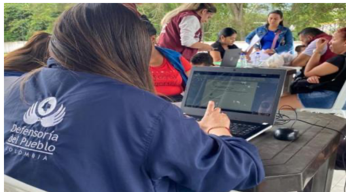
Jornada de Atención Descentralizada. Ocaña, 17 de junio de 2024