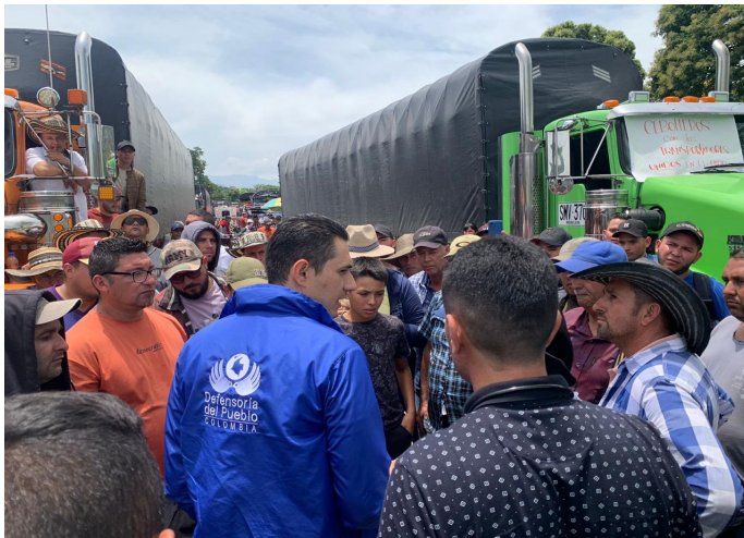
Acompañamiento protesta de Cebolleros en el Municipio de Ábrego