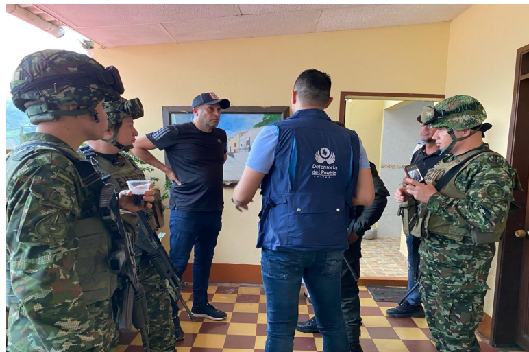
Misión Humanitaria que permitió el regreso a libertad de una persona secuestrada.