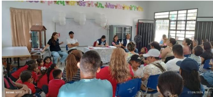
Actividad de promoción y Divulgación. Tierra Azul, El Carmen 27 de septiembre 2024

Periodo a reportar: 01 de enero a 31 de diciembre de 2024