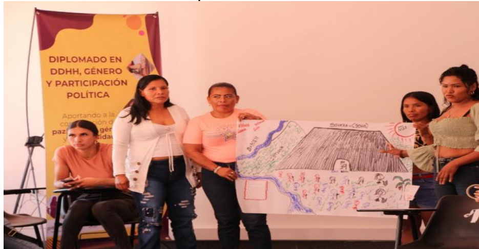
Diplomado DDHH, Género y participación política a mujeres y funcionarios de los municipios PDET

Periodo a reportar: 01 de enero a 31 de diciembre de 2024