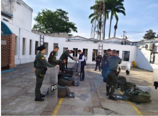
Revisión de UNMDO, Estación de Policía Ocaña.

Periodo a reportar: 01 de enero a 31 de diciembre de 2024