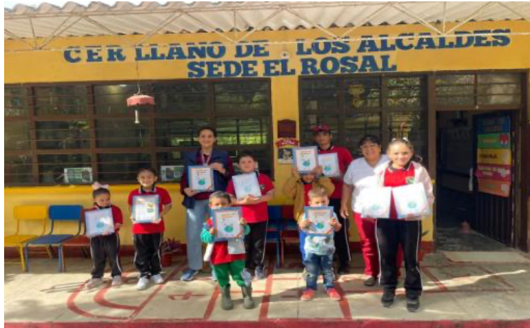
Actividad de Formación CER Llano de los Alcaldes

Periodo a reportar: 01 de enero a 31 de diciembre de 2024