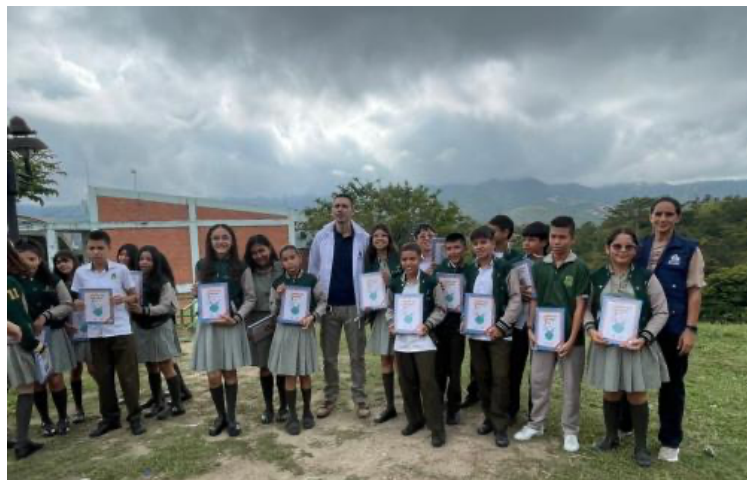
Actividad de Formación Escuela Normal Superior