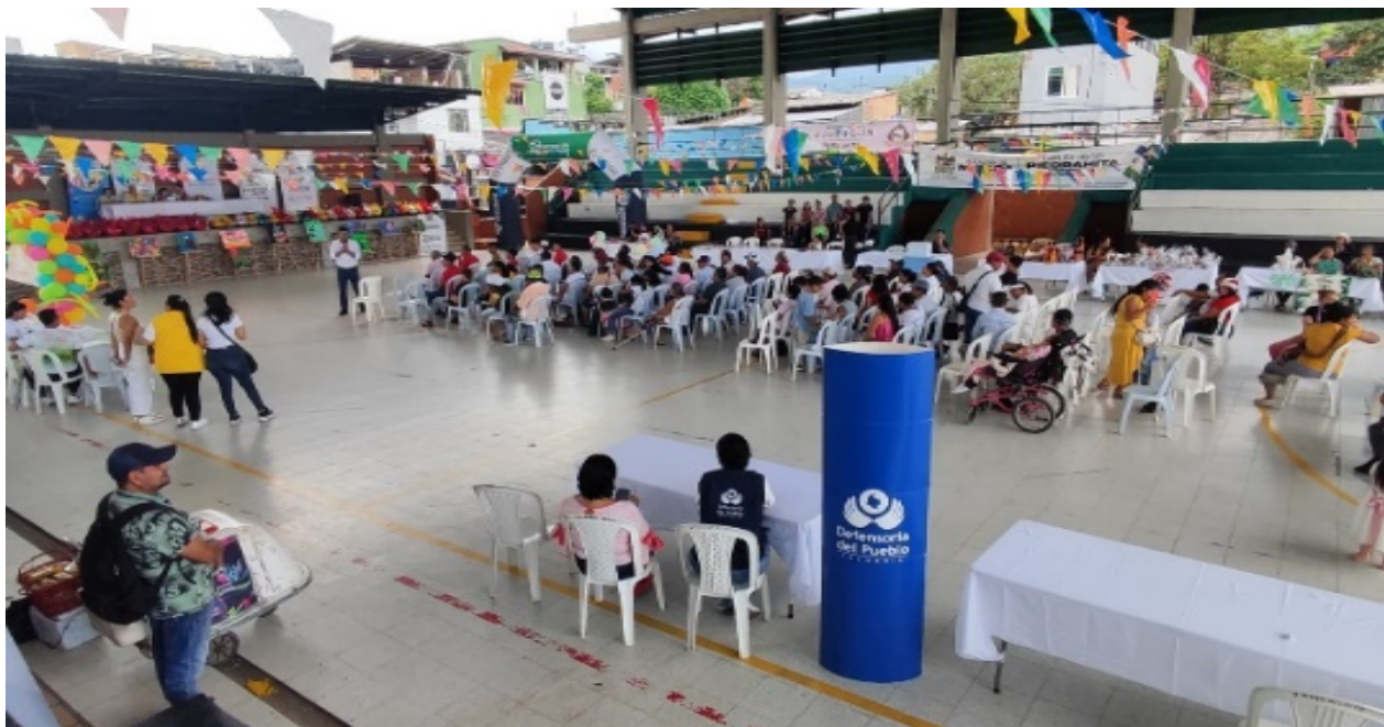
Jornada de atención integral en el municipio de Mocoa

Divulgación: Acompañamiento en 11 actividades de conmemoración, dignificando o recordando fechas y hechos que han marcado la historia de la humanidad y el país, sensibilizando para el respeto y garantía de los derechos humanos.