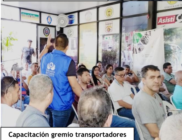
Capacitación gremio transportadores