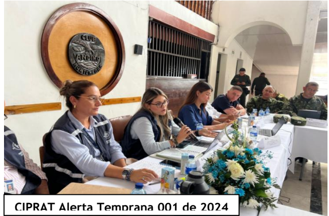
CIPRAT Alerta Temprana 001 de 2024