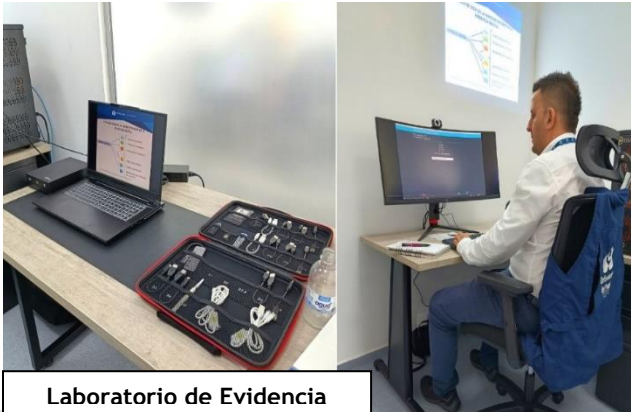
Laboratorio de Evidencia

Periodo a reportar: 01 de enero a 31 de diciembre de 2024