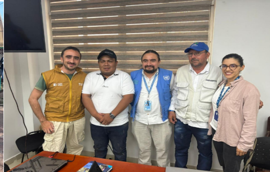
Intervención ante la Droguería Discolmédica- para la entrega de Medicamentos