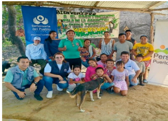
Toma de declaración sujeto masivo