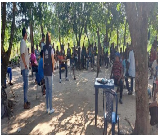
Actividad de Fortalecimiento comunitario

Se realizó el compromiso para el desarrollo de espacios de socialización del fallo de tutela del 10 de febrero de 2022 y para la construcción de un plan de trabajo conjunto.