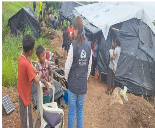
Verificación condiciones en asentamiento