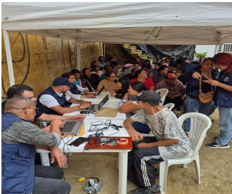
Jornadas de atención a comunidades