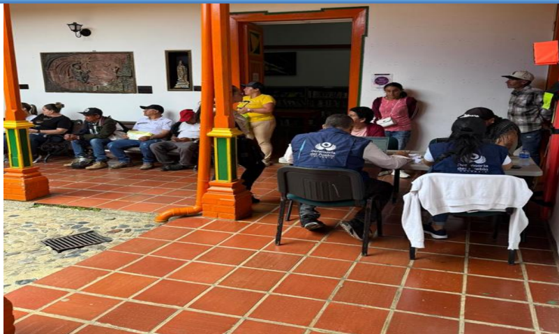
Jornadas de atención a comunidades