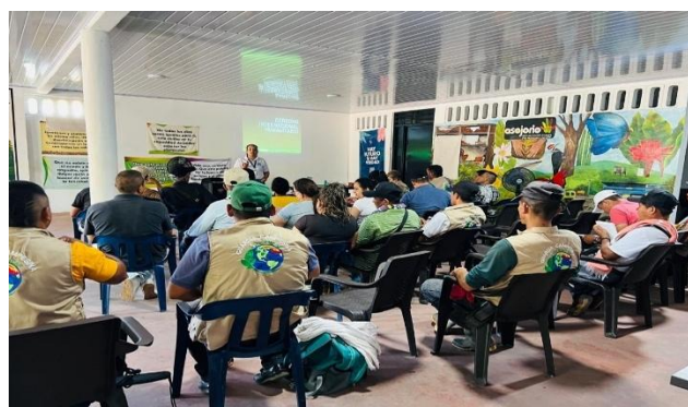
Imagen 2. Capacitación a líderes, lideresas e integrantes de Guardia Campesina del corregimiento de la Aguillilla - Puerto Rico (Caquetá). 01 de noviembre de 2025.