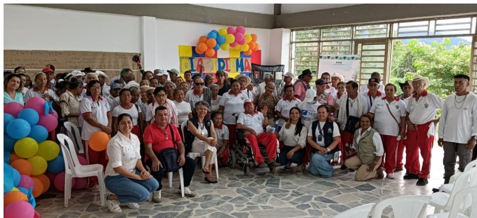
Imagen 3. Seguimiento a las políticas públicas de adulto mayor en el centro vida La gloria en el municipio de Florencia, con adultos mayores beneficiarios del programa centro vida. El día 25 de noviembre de 2025.