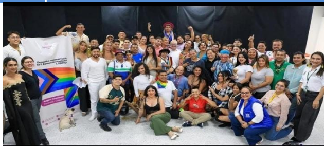
Imagen 1. Convención amazonia LGTBIQ+