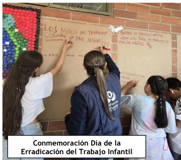
Conmemoración Día de la Erradicación del Trabajo Infantil