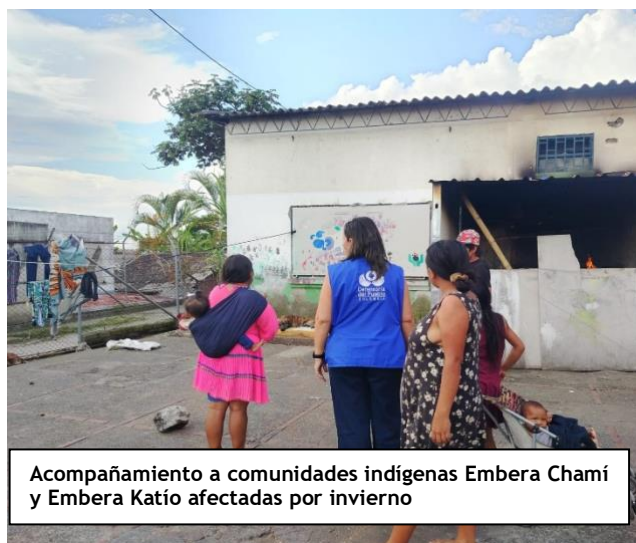
Acompañamiento a comunidades indígenas Embera Chamí y Embera Katio afectadas por invierno