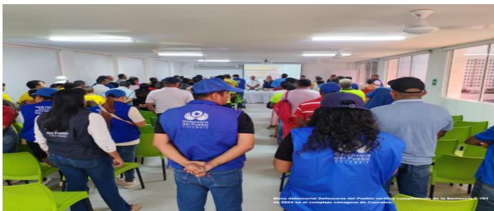
Mesa defensorial: defensoría del pueblo verifica cumplimiento de la sentencia T-163 de 2024 en el complejo cenagoso de Cascaloa Municipio de Magangué