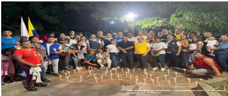
Día Nacional de la Memoria y Solidaridad con las Víctimas del Conflicto Armado-Municipio de Magangué