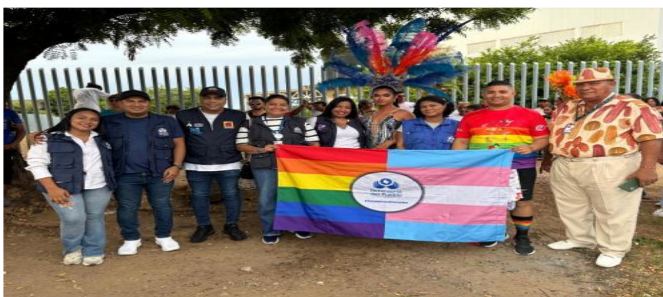
Día Internacional del Orgullo LGBTI. Municipio de Magangué.

Resultados de las acciones en clave de Decálogo de la Defensoría del Pueblo