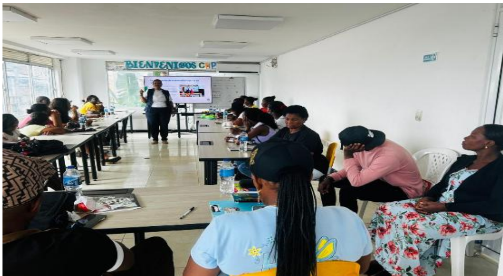
Fortalecimiento comunitario – Delegada para Orientación y Asesoría de las Víctimas del Conflicto Armado Interno