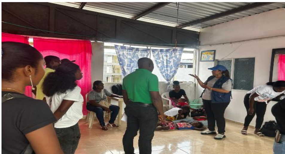
Acompañamiento a emergencias – Ola invernal 2025