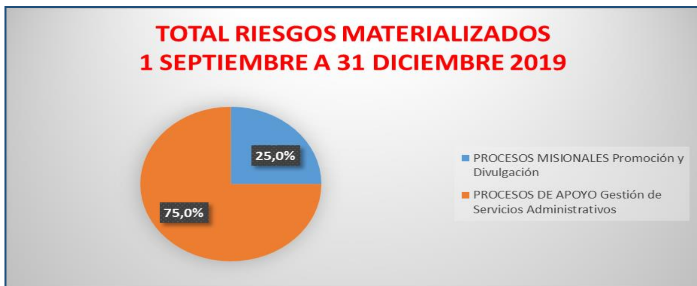
Gráfica 1. Total riesgos materializados por procesos.

Según la gráfica, se presentó mayor porcentaje de materialización de riesgos en el proceso de Gestión de Servicios Administrativos, con un 75% y con un 25% en el proceso Promoción y Divulgación.